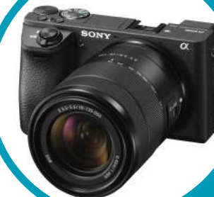
CÁMARA SONY A6400