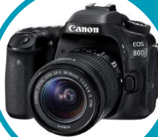
CÁMARA CANON 80D