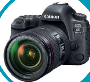
CÁMARA CANON 6D